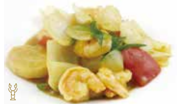
302 -- GAMBERI* AL CURRY