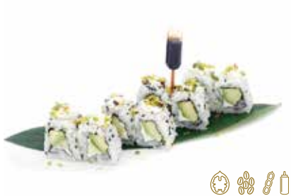
115 -- VEGGIE Avocado, philadelphia esterno con Pistacchio e salsa teriyaki