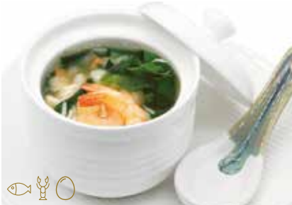
252 -- ZUPPA DI MARE Uova, gamberi*, granchio*, alghe