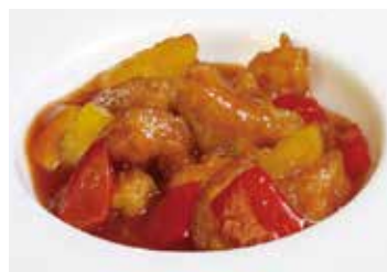
295 -- POLLO AGRO DOLCE