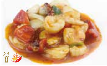
301 -- GAMBERI* PICCANTE