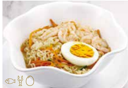
253 -- RAMEN FRUTTI DI MARE Spaghetti di ramen in brodo con frutti di mare*