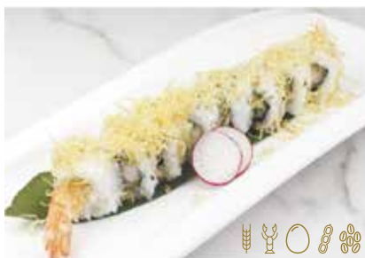
113 -- EBITEN Gamberi* fritto, maionese, con pasta kataifi e salsa teriyaki