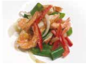
304 -- GAMBERI* CON SALE E PEPE