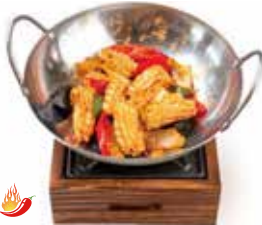
311 -- SCODELLA DI FUOCO CON CALAMARI PICCANTE