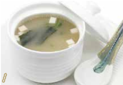
250 -- ZUPPA MISO Zuppa di tofu, alghe