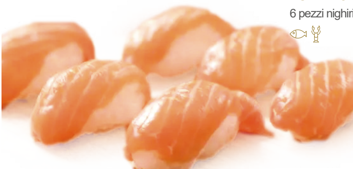
181 -- SUSHI SOLO SALMONE 6 pezzi nighiri