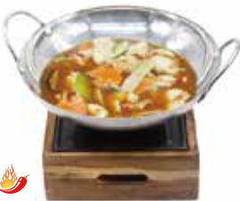
310 -- SCODELLA DI FUOCO CON POLLO PICCANTE