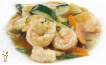
300 -- GAMBERI* CON VERDURE