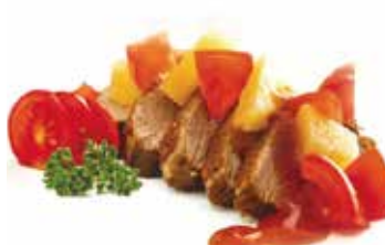
291 -- ANATRA AGORO DOLCE