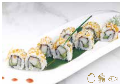
112 -- CALIFORNIA Surimi di granchio*, avocado e maionese esterno con tobiko