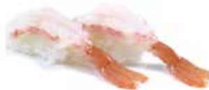
174 -- AMAEBI gamberi* crudi