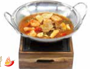
312 -- SCODELLA DI FUOCO CON GAMBERI* PICCANTE