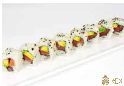
111 -- MAGURO Tonno e avocado