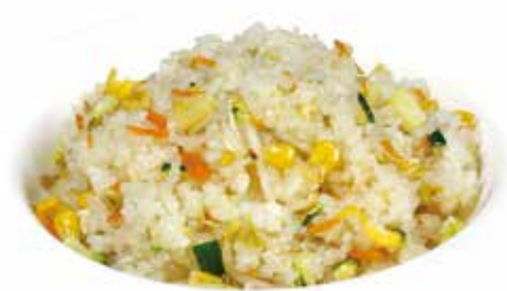
261 -- RISO SALTATO CON VERDURE E UOVA