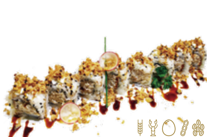
114 -- URAMAKI TONNO ROLL Tonno cotto, avocado, maionese, granella Di cipolla fritto, salsa teriyaki