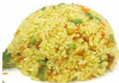
265 -- RISO SALTATO CURRY CON POLLO