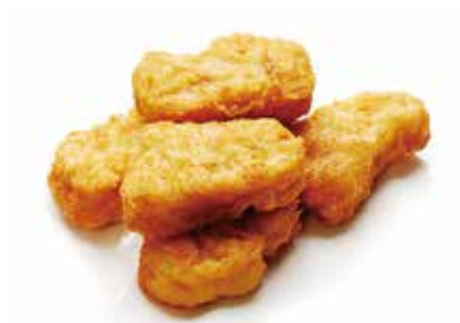
324 -- NUGGETS Crocchette di pollo fritto