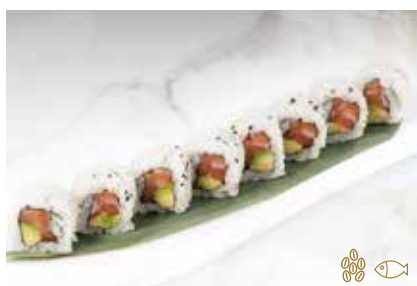
110 -- SHAKE Salmone e avocado