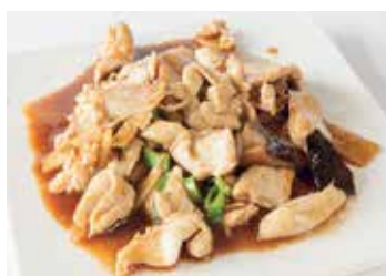
297 -- POLLO CON FUNGHI BAMBÙ