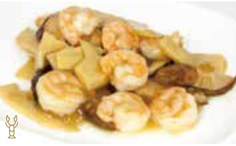
303 -- GAMBERI* CON FUNGHI BAMBÙ