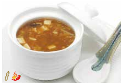
251 -- ZUPPA AGRO PICCANTE Tuofu, uova, bambù e funghi