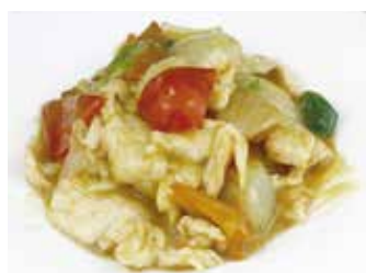
296 -- POLLO AL CURRY