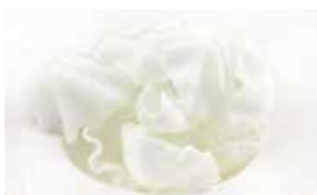
17 -- NUVOLE DI GAMBERI