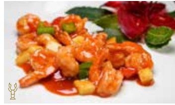
305 -- GAMBERI* AGRODOLCE