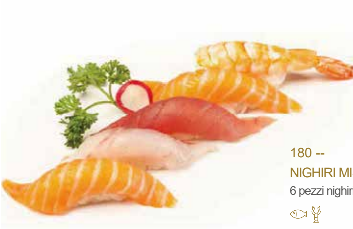
180 -- NIGHIRI MISTO 6 pezzi nighiri