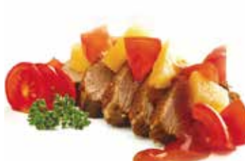
291 -- ANATRA AGORO DOLCE € 10.00