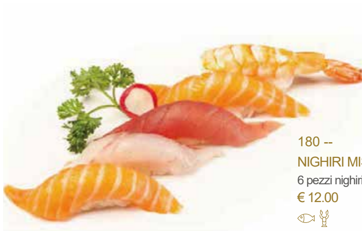
180 -- NIGHIRI MISTO 6 pezzi nighiri € 12.00