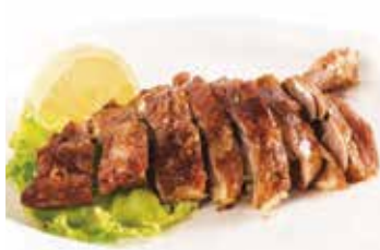
290 -- ANATRA CON SALE E PEPE € 10.00